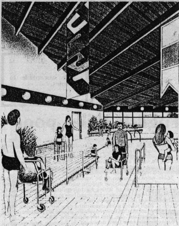
Artist's conception of a swimming pool specially designed for use by the handicapped.