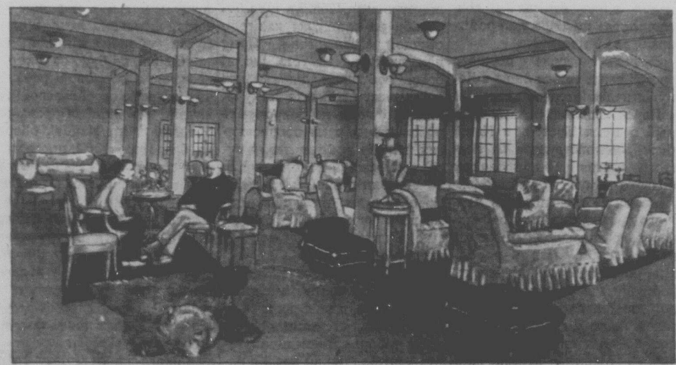
Кімната відпочинку в клубі-палаці робітників-металістів в місті Дніпропетровську на Радянській Україні. В цій кімнаті меблі ті самі, що до революції були в діпрі буйного російського царя Миколи другого.

Через чехізацію Підкарпатської України, що відбувається в супроводі аграрного грабунку від чеських та малярських поміщиків, українське селянство залишається без освіти в віковій темряві. Чеська "демократія" провадить скажену боротьбу проти справжніх захисників трудящих Підкарпатської України, українських комуністів.