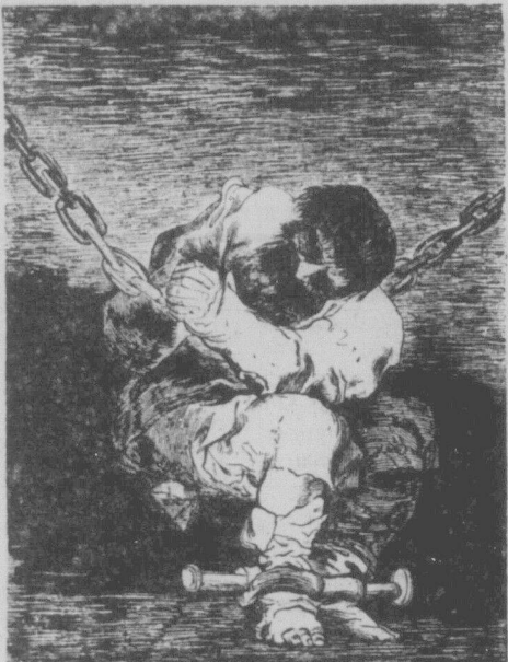
Перше травня на Західній Україні.

У таких обставинах живе, працює й бореться український трудящий народ. Робітникам