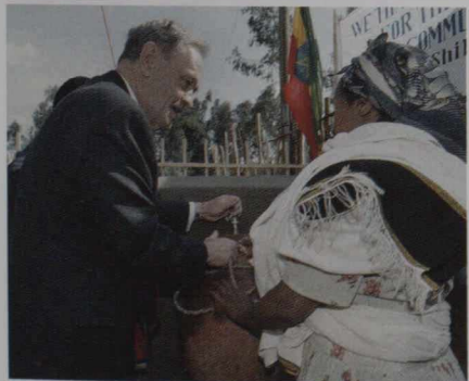
< Le premier ministre et M me Chrétien reçoivent des cadeaux de représentants du village de Bamishi, près d'Abuja, au Nigéria.