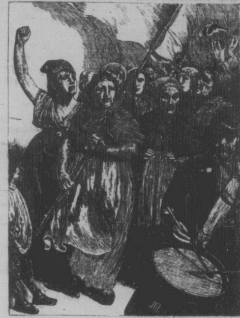
Комунарки вчасі Паризької Комуні.

Канадійська буржуазія також послала свій терор проти робітників. Одночасно з горячковим готуванням до війни проти Радянського Союзу, канадійські капіталісти засво-