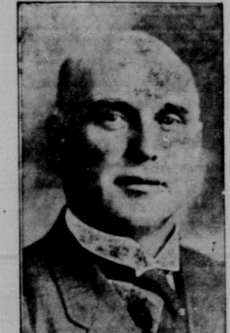
Hon. Charles Stewart