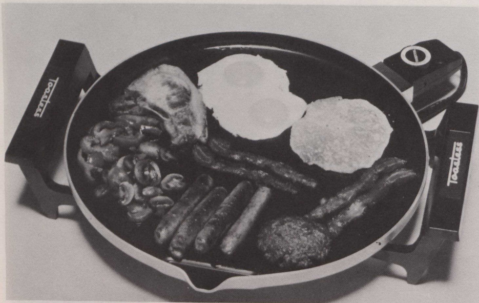
Le grilloir automatique format familial est un appareil durable à surface non collante Silverstone. Le grilloir peut aussi servir de réchaud et de plat de service.

En revanche, les congélateurs n'en sont qu'à 50 % de leur point de saturation maximale, ce qui s'explique en grande partie par les dimensions restreintes des habitations urbaines et, en particulier, des appartements actuels. Toujours à l'affût des besoins du consommateur, les sociétés fabriquent maintenant des congélateurs de petite taille en fonction de cette situation nouvelle.