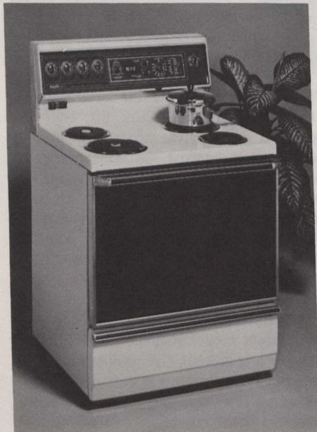
Une cuisinière électrique.

Le degré de saturation le plus élevé est celui du secteur de vente des appareils de cuisine de base, notamment des réfrigé-