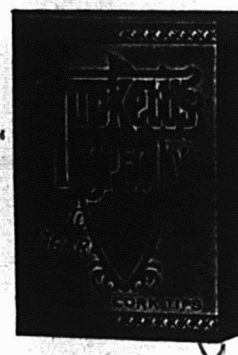
The Geo. E. Tuckett & Son Co., Limited. HAMILTON, ONT.