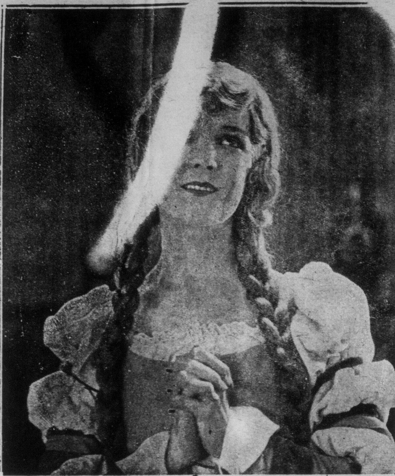
MARY PHILBIN DANS "LE FANTOME DE L'OPERA" AU THEATRE REGENT.

La prochaine comédie de Harold Lloyd sera "For Heaven's Sake".