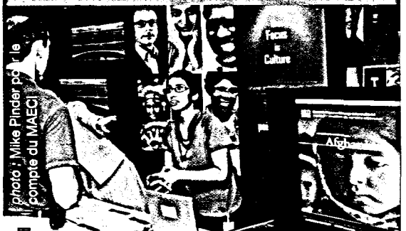
La magie de l'audiovisuel à la journée Portes ouvertes à Ottawa

Grâce à sa bonhomie et à l'importance accordée à l'excellence des relations avec les clients, cette équipe fait toujours de son mieux. Nous lui sommes reconnaissants de ses efforts acharnés pour assurer la réussite de toutes nos activités.