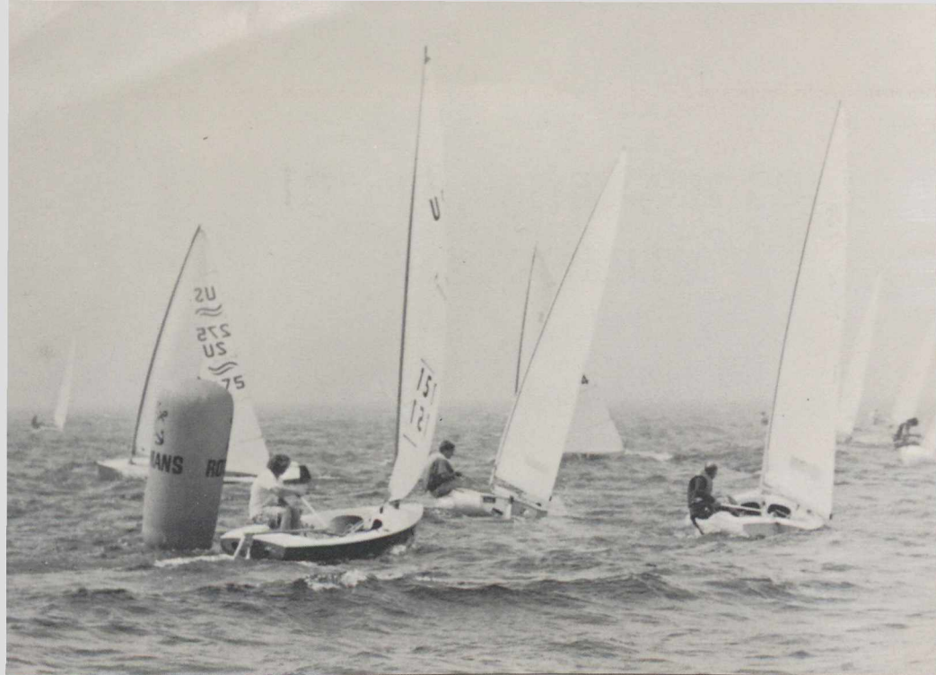
Au large de Kingston, sur le lac Ontario, où se dérouleront les épreuves de voile.