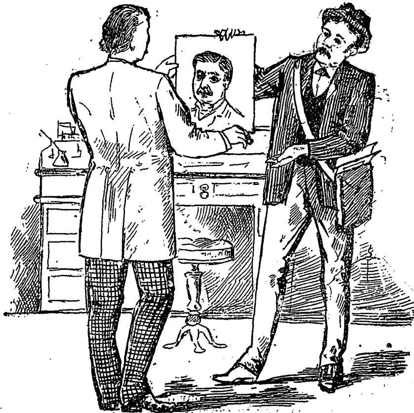
Beaugrand vendant le portrait de Mercier. CHAPLEAU.—Que ne puis-je avec, acheter aussi l'original.

lassinier. Pendant son élection ses adversaires disaient qu'il lassinait les électeurs.