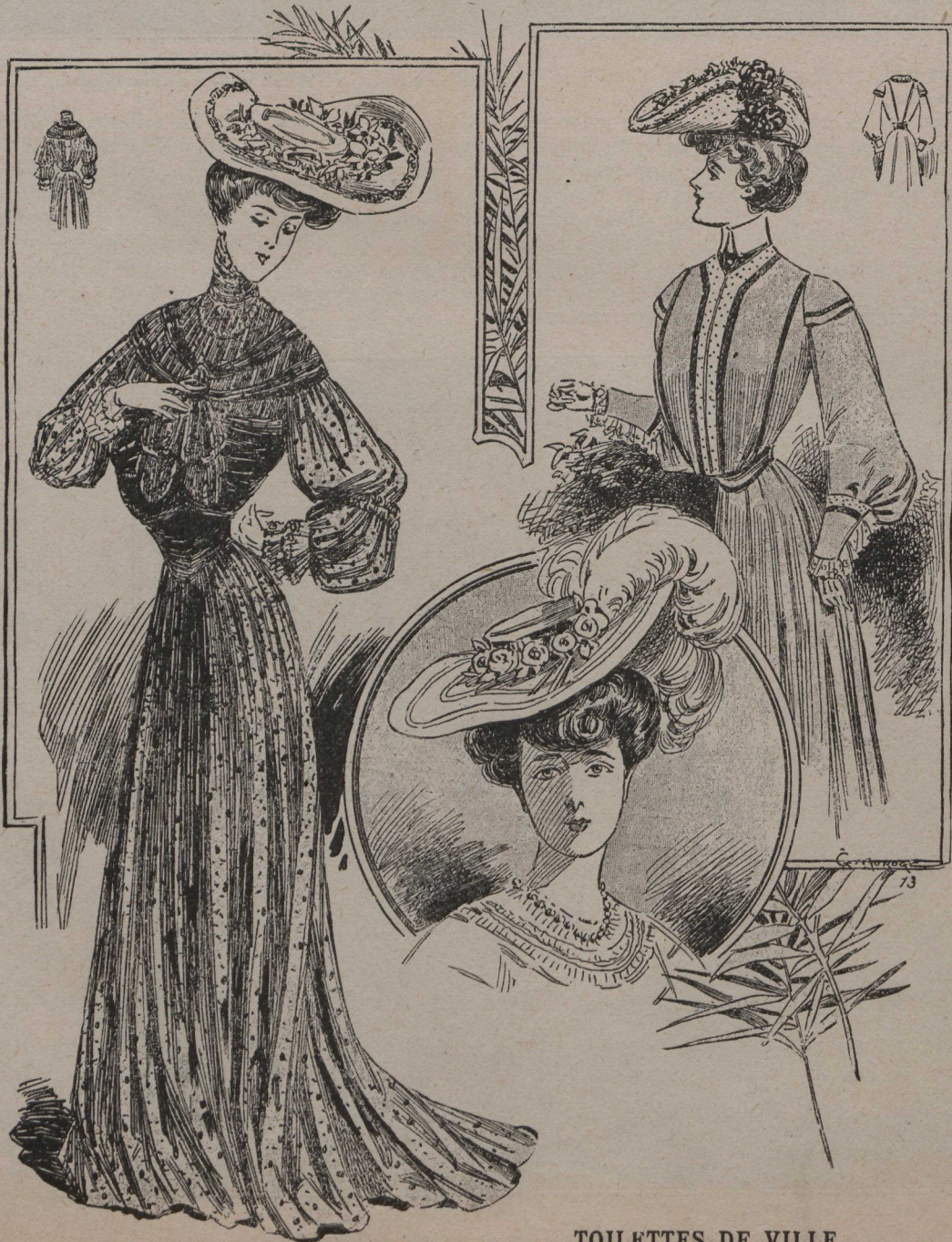
TOILETTES DE VILLE

CHAPEAU de crin noir cerclé de velours et de roses coq de roche, avec deux longues plumes noires retombant sur les cheveux.