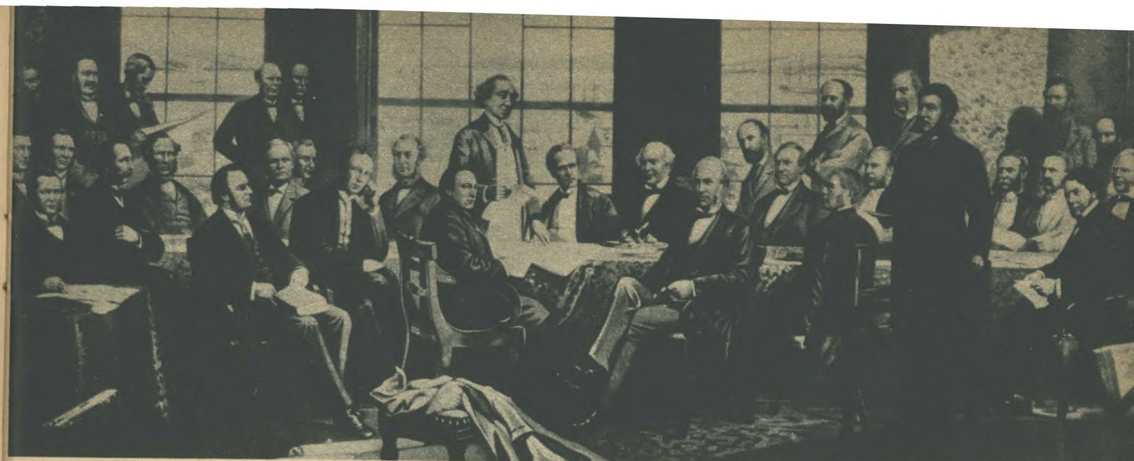
Ils ont fondé une nation (Confédération, 1867).

Les légendaires bûcherons, constructeurs de vaisseaux et pêcheurs firent bientôt place à un nombre grandissant d'agriculteurs qui récoltaient sur les vastes plaines de l'Ouest un nouveau et précieux produit, le blé. Un système tarifaire élevé stimula l'économie industrielle naissante.