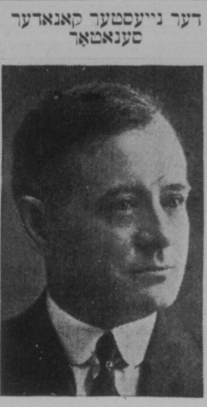
דער נייעסטער קאנאדער סענאטאר

ווען מיר זאגן, א דאך פאטעטישע מעשה'לאך האט ק, מירט ניט געראטט פארן אויך ווייזט זיי ארץ ישראל, נאר ער האט געקאנט געפינען זיי אביסל עקסצעס צו זיי אין סאטוויסירטן פון היינטיקן טיפן סאגן, למשל (א חרוב פארענען און פאטעטישע צענען, וועלעך ער זאל אליין האבן ביגעוואוינט):