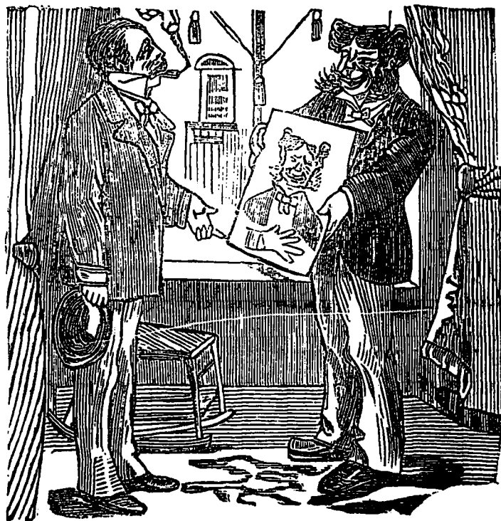
UN COEUR SENSIBLE.

BRID'OUX. — Dis-moi donc, Chafouih, pourquoi tu mets ton portrait à la fenêtre ?