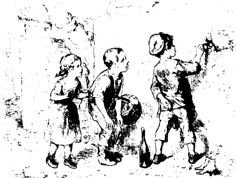
UN ARTISTE EN HERBE.

— Mademoiselle, je ne puis plus taire mes sentiments : je vous aime ! — Pour l'amour de Dieu, levez-vous ! Attendez du moins que le convoi soit passé ! Ne voyez-vous pas que vous nous compromettez tous deux !