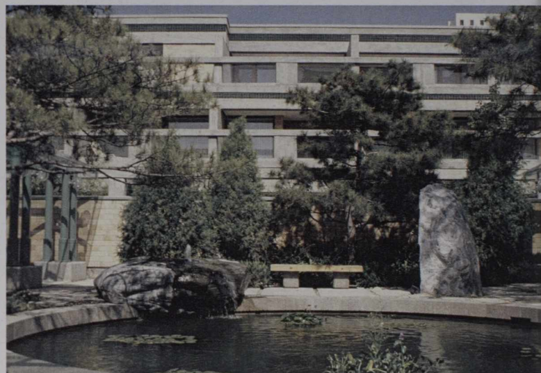
Ambassade canadienne à Beijing.