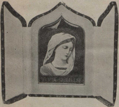
Image de la Vierge, en émail sur fond de velours. Ecrin de maroquin.

leur vie. On voit poindre, en elles, la future femme; elles ont une part plus active dans les travaux de leurs mamans; une part plus intime dans sa confiance: elles deviennent la petite amie; on leur parle sérieusement, gravement.