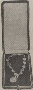
Dizaine-porte-bonheur en argent. Ecrin en maroquin doublé de velours.

Ces choses gracieuses auront été précieusement serrées dans le coffret aux souvenirs chers, et elles rappelleront plus tard, au milieu des contre-temps et des vicissitudes de la vie, l'époque très douce des élans mystiques et de la bienheureuse purté de l'âme.