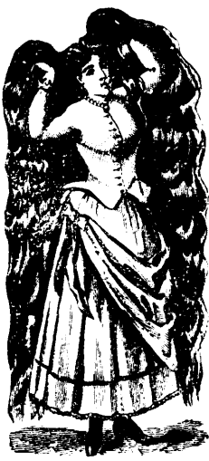
Marque de Commerce.

Cette préparation est hautement re- commandée par des personnes compétentes, plusieurs médecins et autres.