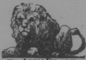
The LION BRAND KNICKERS