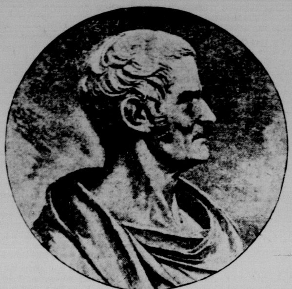
Per Henrik Ling.

I ett sekel har Gymnastiska central-institutet i Stockholm fostrat svenska män och kvinnor till friska och sunda människor, sprifvit det svenska namnet öfver världen och gjort den svenska gymnastiken arad och ansedd i alla civiliserade länder. Ej att undra öfver då det alltid hela Sverige varit därifrån utgående våra stora högtid-ligheter.