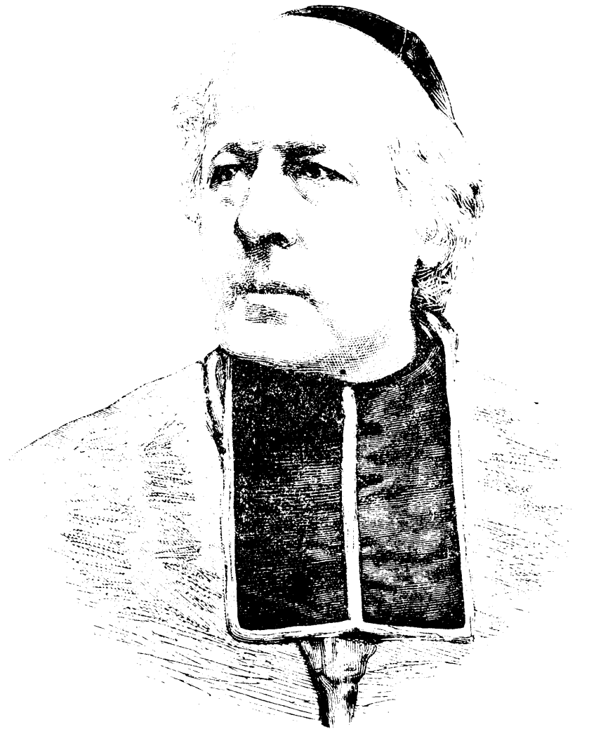
MONSEIGNEUR GUILBERT, ARCHEVÊQUE DE BORDEAUX