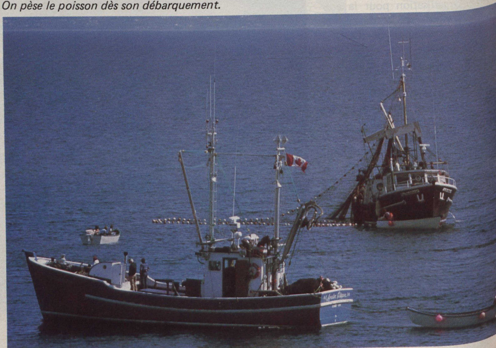
Pêche au maquereau au large de la côte est du Canada.