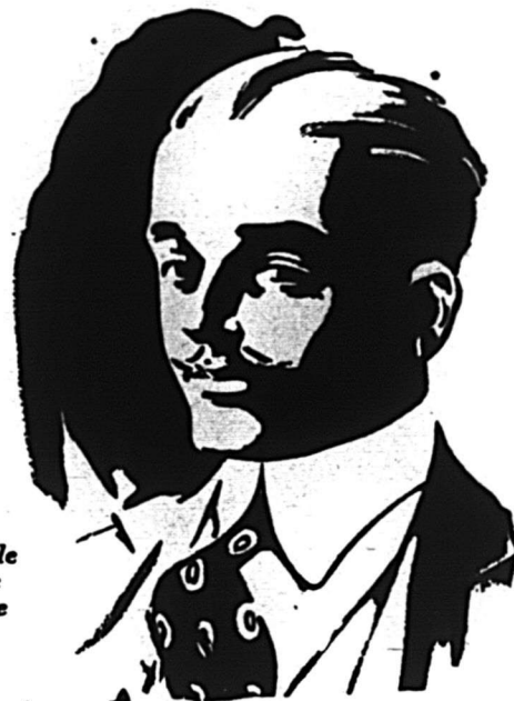
Nouvelle forme ajustée