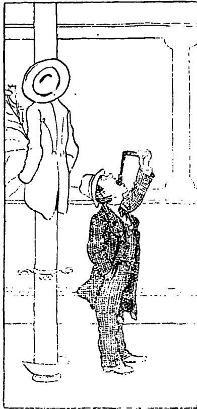
...Peut-être pourrai-je me l'approprier sans éveiller l'attention..., essayons..