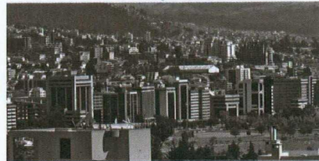
La grande croissance urbaine alimente la demande de technologies et de services en matière de télécommunications et d'environnement.

Au Venezuela , les télécommunications continuent de croître rapidement, surtout dans le domaine de la téléphonie mobile, où l'on trouve près de 9 millions d'abonnés, soit un taux de pénétration du marché de 33 % – plus du double de celui de la téléphonie fixe. Il existe des débouchés dans les communications VoIP et à large bande, les applications de sécurité, les systèmes d'acquisition et de contrôle des données et les communications Wi-Fi.