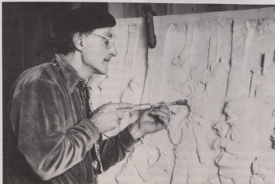
Un sculpteur sur bois en train de réaliser une murale.