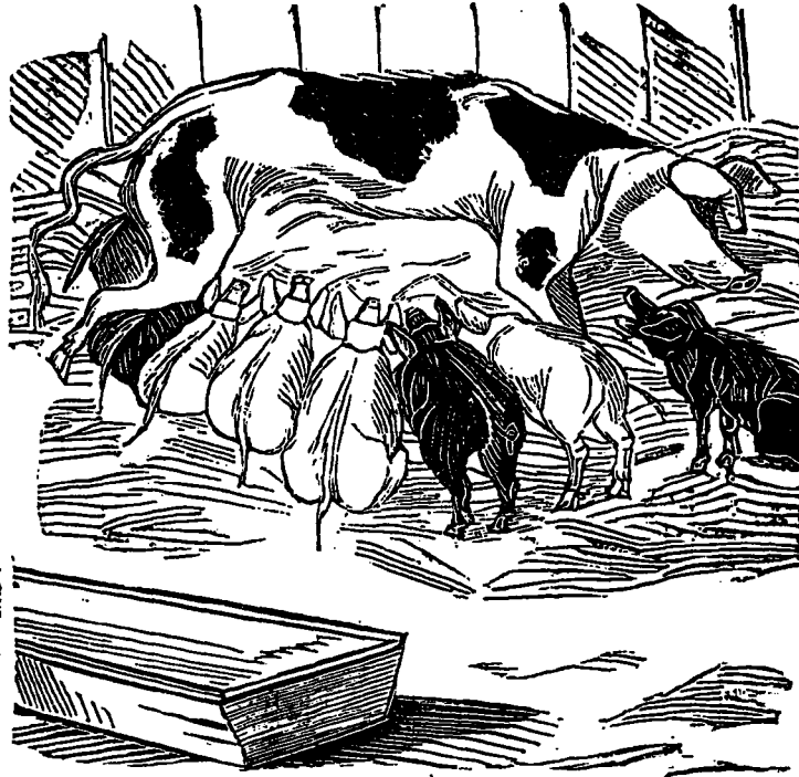
Où peut-on être mieux qu'au sein de sa famille ?

N'oubliez pas que vous achetez les plus beaux Chapeaux de Dames chez LE TENDRE, ARSENAULT & CIE. 591 Rue Ste Catherine.