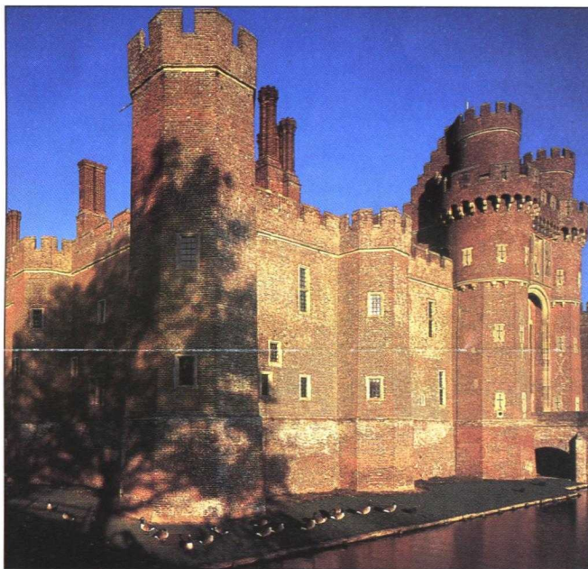
La Conférence Perspectives des Jeunes de 1996-1997, « Le Canada et l'Europe », a récemment permis aux jeunes des deux côtés de l'Atlantique de débattre des dernières tendances en relations internationales. La rencontre a eu lieu au château de Herstmonceux, à Hailsham, en Angleterre, qui appartient à l'Université Queen's du Canada.

En octobre 1996, l'ambassade du Canada à Madrid a tenu une série de manifestations en l'honneur de Bethune. Le public est venu en grand nombre assister aux conférences, au lancement d'un livre et à la présentation de films comme « Bethune », mettant en vedette l'acteur canadien Donald Sutherland.