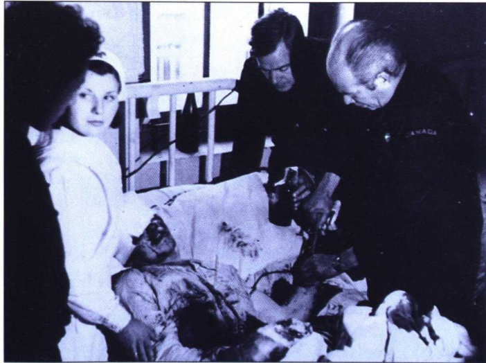
Le D r Norman Bethune donnant une transfusion de sang à un soldat durant la guerre civile espagnole.

Après son arrivée en Espagne, le D r Bethune a créé le service canadien de transfusion sanguine. Il s'agissait du premier service de transfusion sanguine mobile mis sur pied dans le monde pour sauver des vies en période de guerre. Jusqu'à son départ d'Espagne à la fin de 1937, le D r Bethune a suivi les combattants dans leurs déplacements afin de pouvoir soigner les blessés grâce à son service de transfusion.