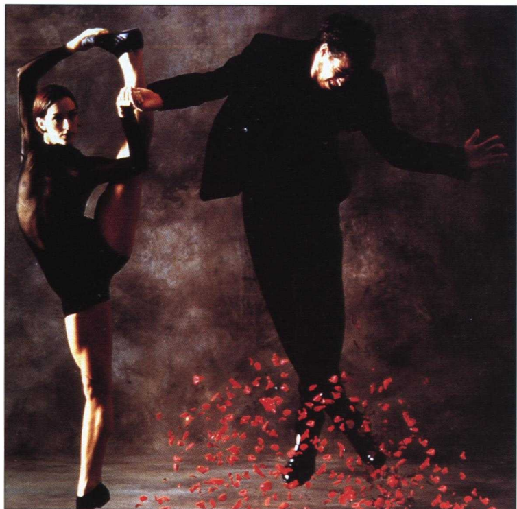
La compagnie de danse canadienne La La La Human Steps participera aux festivités qui auront lieu cette année à Thessalonique.