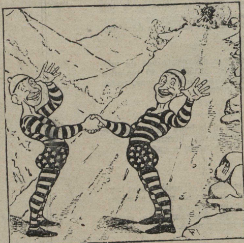
UNE RUSE DE CLOWNS

Comment les frères Jim trouvèrent moyen de passer devant le lion sans être attaqués par le terrible animal.