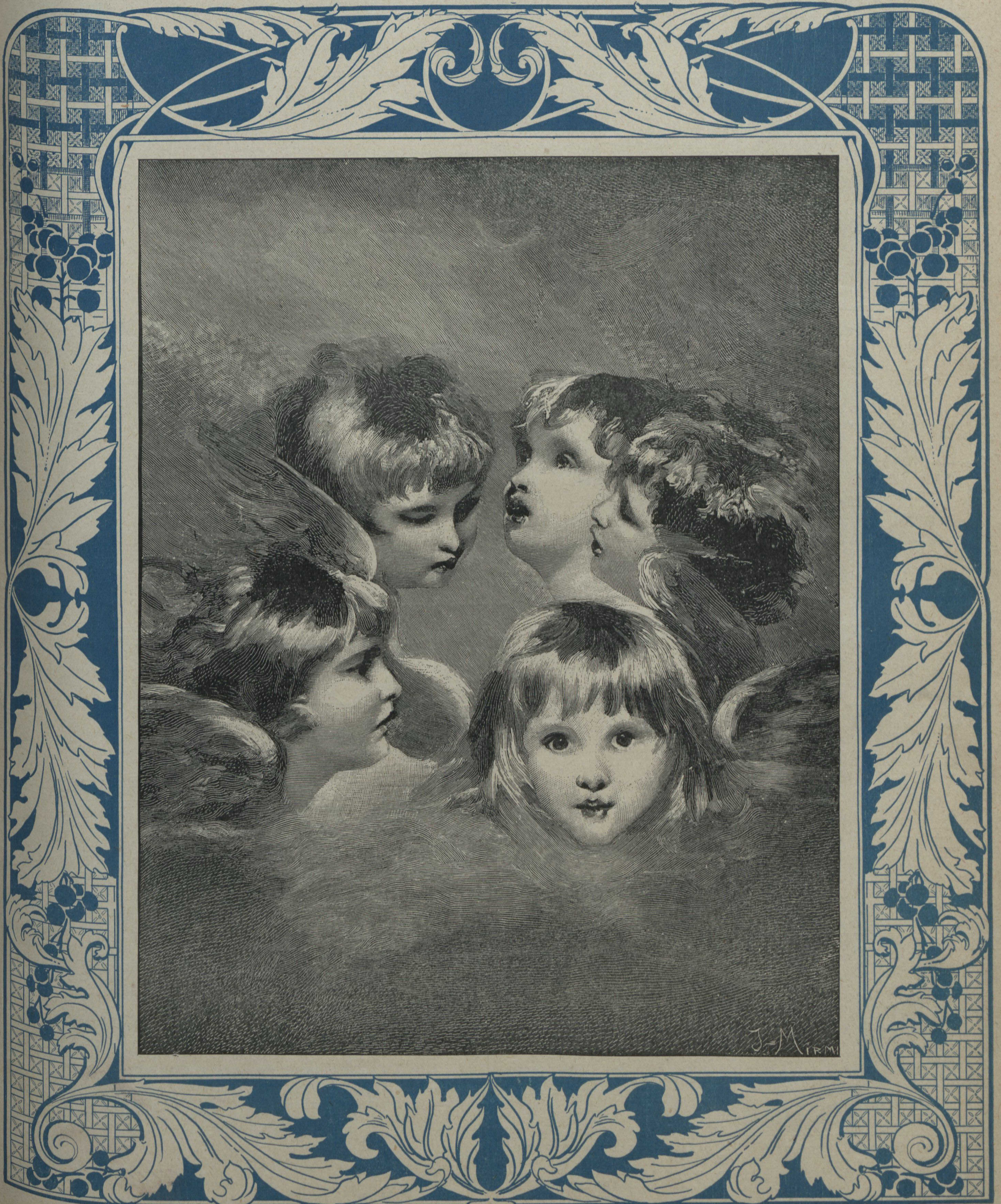
TÊTES D'ANGES. D'après REYNOLDS.