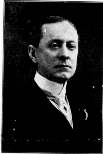
SON EXCELLENCE ARAM J. POTHIER, Gouverneur du Rhode-Island.