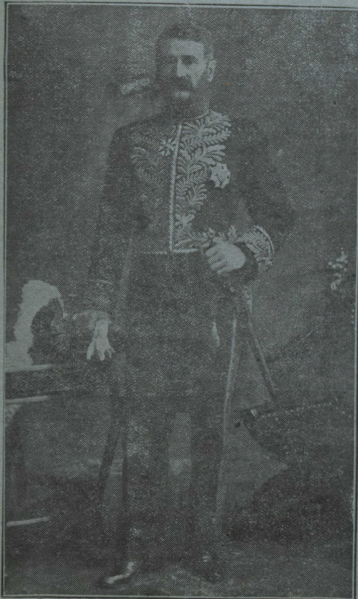
SIR ALPHONSE PELLETIER,

■ Lieutenant-Gouverneur de la Province de Québec, sous le patronage duquel le concours du "Journal de Françoise" a eu lieu.