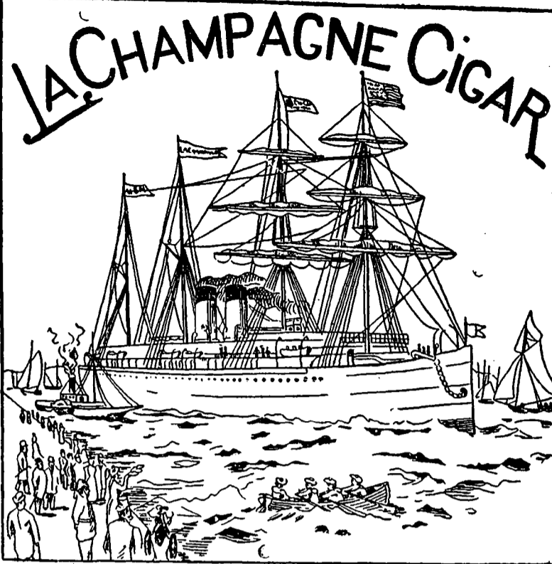
PETIT DUC, LA FINE CHAMPAGNE, LA CHAMPAGNE R. V. B. "Curling Cigar," fait à la main valant 10c pour 5c.