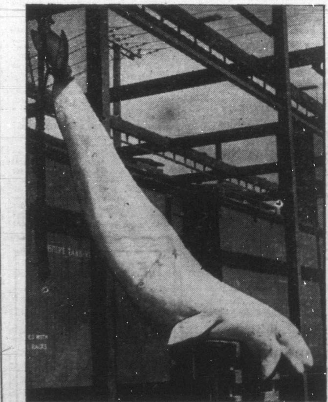
Fehér cápák érkeztek egyenesen a Hudson-öbölből a st.-bonifaceli Harris vágóhidra. Az egyenként 25 láb hosszú, 1.500 font súlyú hatalmas vízi szörnysátokeket Kanadában feldogozzák és a belőlük sajtolt olajat Angliába szállítják. Ha a kísérlet sikerül, úgy tömegesen szigonyozzák majd a fehér ceketek a Hudson-öbölben, különösen miután a kisajtolás után hátramaradt testrészeket porlasztás után mint kiváló műtrágyát tudják majd Kanadában felhasználni.

A rendőrség a kommunis-títkos pártirodájában 18 külön-Folytatás a 6.-ik oldalon.