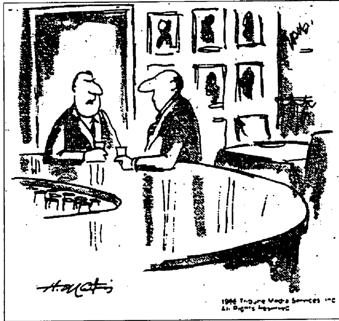
Ça ne me fait rien d'être un «employé», mais je n'aime pas être «du personnel» et il n'est pas question que je devienne une «ressource humaine».

POUR RENSEIGNEMENTS : Kathy Aleong (a/s d'APT)