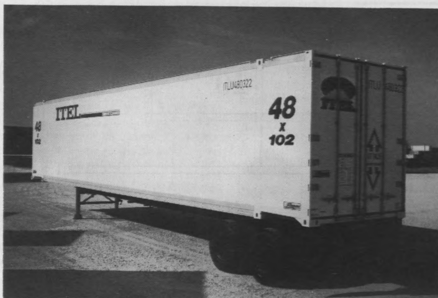
Conteneur de 48 pi pour le transport intérieur.