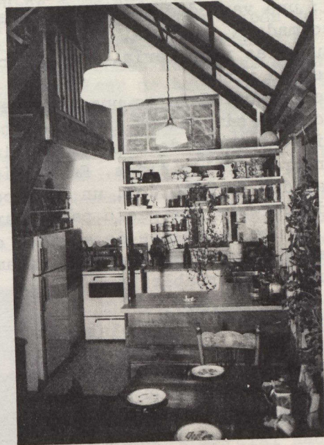
Vista del comedor y cocina con las toberas de la pared Trombé abiertas en el lado derecho superior. Los recolectores de agua calentada por el sol están situados encima del techo abovedado.