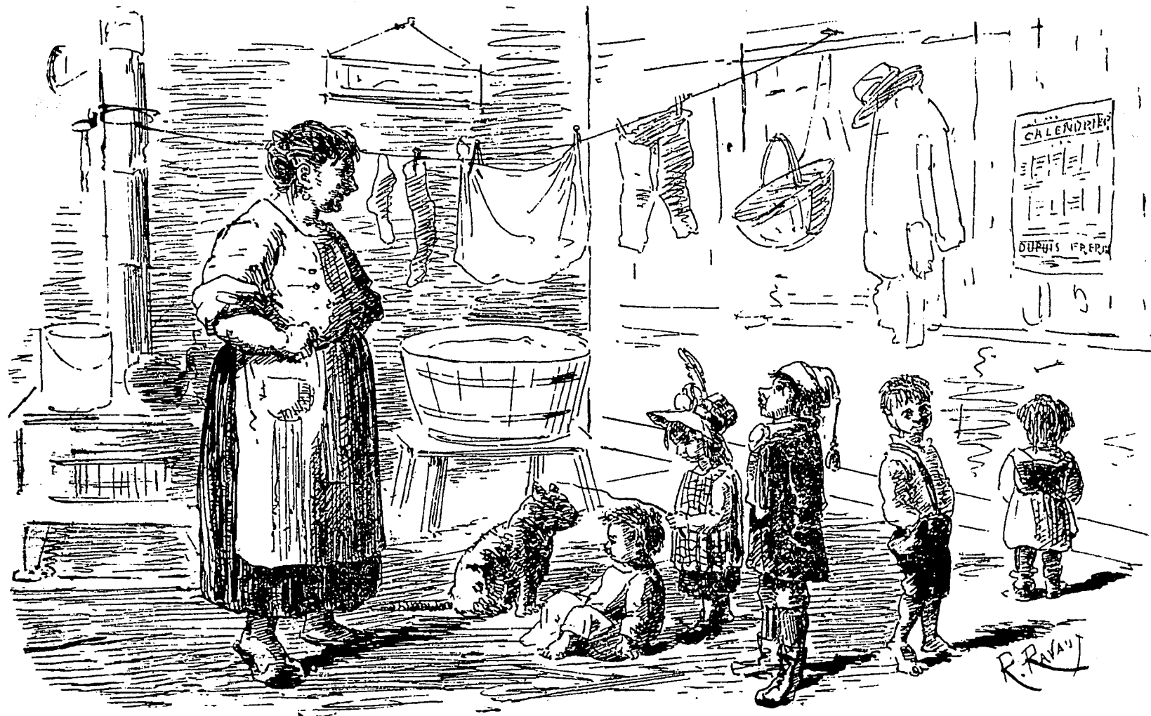
Une bonne mère de famille se demandant avec anxiété lequel de ses rejetons elle enverra à l'Exposition des Bébés, organisée par LA VIE ILLUSTRÉE.