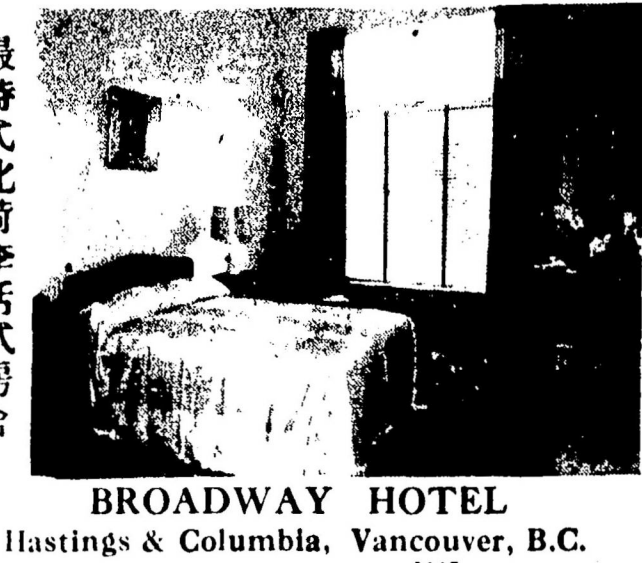
BROADWAY HOTEL Hastings & Columbia, Vancouver, B.C. TELEPHONE PACIFIC 3445 3446

請留宿最現代化之 布律委大旅店 傢私全部新裝，升降機代步，房間電話傳達，音機聽取新聞。