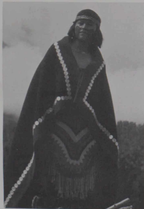
West-kust Indiaan in traditioneel costume.

In de loop der tijd is er een aantal verdragen tussen de Indianen en de regering gesloten, de zogenoemde 'treaties'. Bij deze overeenkomsten werden, zowel voor als na de Confederatie, stukken land aan de regering overgedragen. Zij bepaalden de grenzen en hoe ze moesten worden bestuurd. In ruil daarvoor werden gebieden bestemd voor reservaten en kregen de Indianen die er woonden een jaarlijkse som geld en vergunningen om te jagen en te vissen.