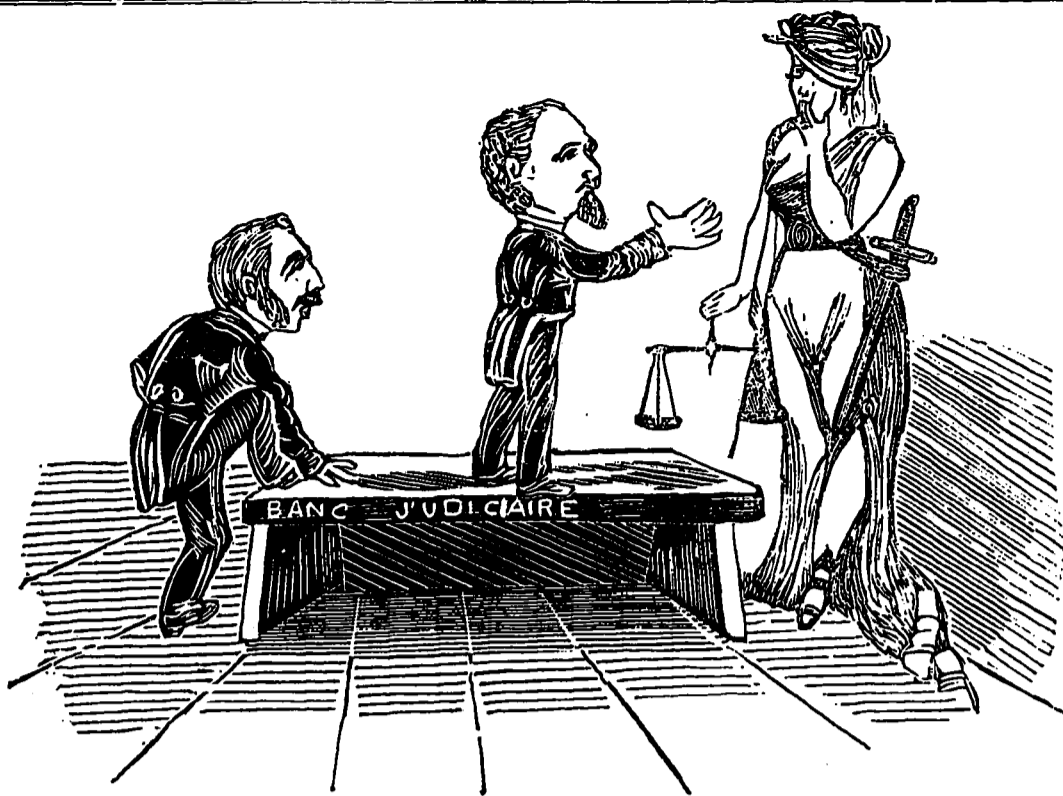
DEUX NOUVEAUX SOUPIRANTS.

Abonnez-vous à l'ALBUM MUSICAL le plus beau journal du pays.