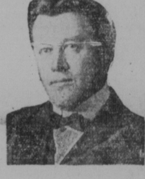
Hon. J. T. M. Anderson.

Utan tvivel kan det bästa resultatet uppnås just genom ett opartiskt avgörande av en fristående tribunal enligt det framställda förslaget. partierna. I lördags öppnades riksdagen under sedvanliga ceremonier i den nyresterade rikssalen. Tron-talet beväddade sänkta inkomskatter och åtgärder för jordbruksnäringens upphjälpande, främst spannmålstullarnas höjande. Riksstas visat en balans på åttahundraåtta miljoner kronor. Remissdebatten är utsatt till fredagen. Ett särskilt utskott skall tillsättas i jordbruksfrågan. Redan de första dagarna har ett stort antal motioner avlämnats, däribland flera beträffande tullar på spannmål.