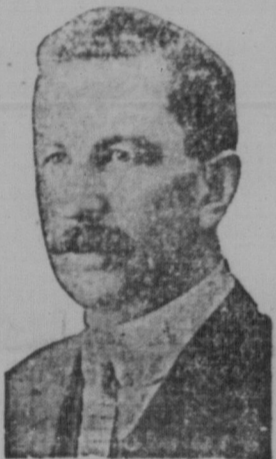
Hon. T. A. Crerar.