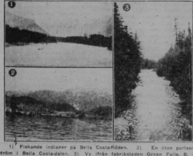
1) Fiskande indianer på Bella Coola-floden. 2) En liten portlandström i Bella Coola-dalen. 3) Vy från fabriksstaden Ocean Falls, B. C.

Mr. F. har legat äktenskap i Bella Coola. Hans fru häromliden från Nordland, Norge. Han har två barn. Han är starkt religiös anhängare och har skrivit ett flertal artiklar både på engelska och norska. Jag vill uttrycka en förhoppning om, att Norges framtid kan få räkna på Mr. F. som en mera stadigvarande skribent, så snart han tid tillåter.