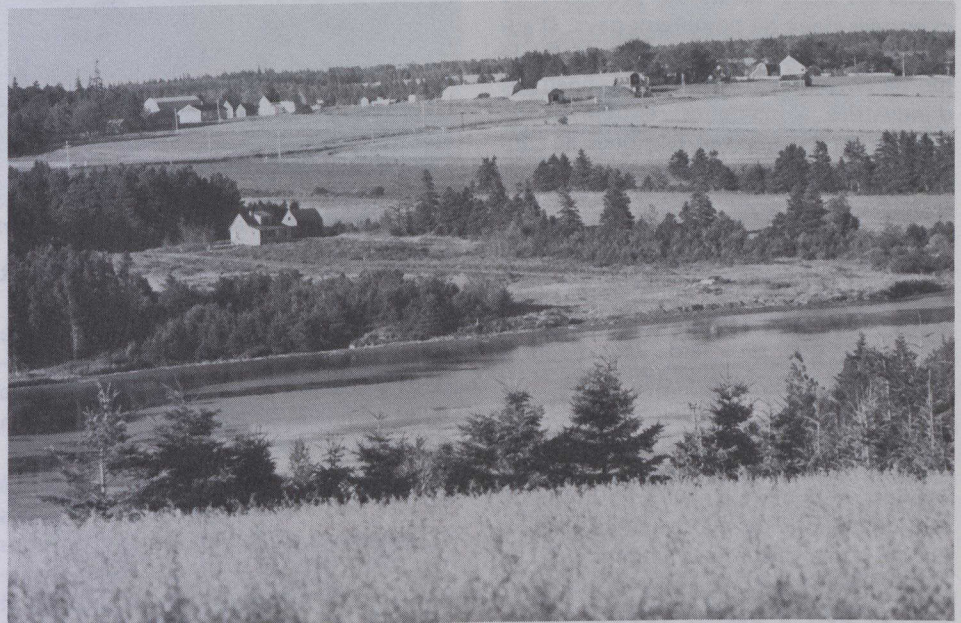
L'Île-du-Prince-Édouard est célèbre pour la douceur de ses paysages.