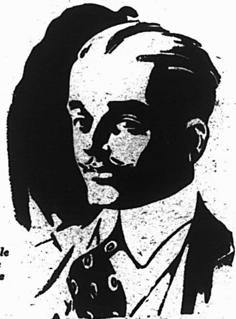
Nouvelle forme ajustée

CHURCH & DWIGHT LIMITED Manufacturiers MONTREAL