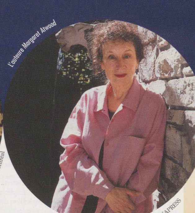
L'auteure Margaret Atwood