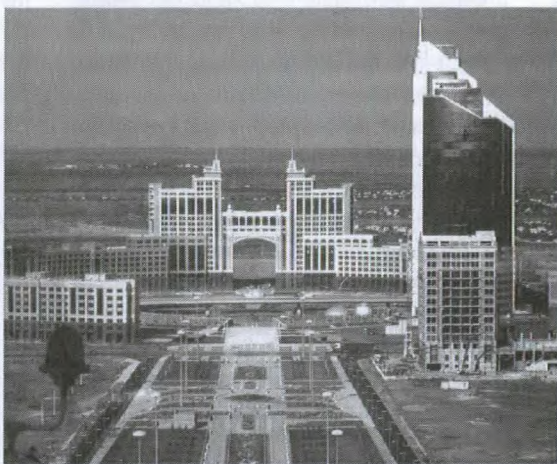
Immeubles gouvernementaux dans la nouvelle capitale du Kazakhstan, Astana.

Il existe de nombreux autres débouchés, notamment les projets associés au développement des principales villes du pays — construction, rénovation, conception et assemblage, gestion de projet, projets clés en main — de même que les projets associés au développement de l'infrastructure nationale — réfections, agrandissement ou construction de ports, d'aéroports, de routes et de réseaux de distribution d'électricité. Les produits et services qui présentent un intérêt particulier