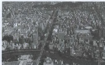
Vue aérienne d'Hiroshima

semblent jeter leur dévolu sur Tokyo et Osaka. Pourtant, d'autres villes japonaises peuvent aussi être très intéressantes et cela, tant pour les entreprises qui veulent s'implanter sur le marché que pour celles qui veulent y étendre leur activité. Située dans le Sud du Japon, dans la région de Chugoku, Hiroshima est une de ces villes méconnues pourtant très riche en débouchés.