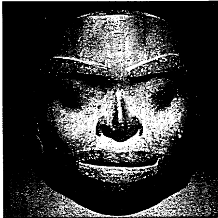
Masque – Tsimshians de la côte période préhistorique.